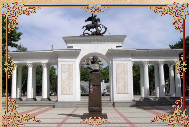
Мемориальная Арка «Ими гордится Кубань», 1997 г.

В нашем городе тоже есть памятники героям Великой Отечественной войны, сражавшимся за наш любимый город. И сегодня мы с вами посмотрим на такие памятники, чтобы вспомнить о тех боевых днях, о солдатах, которые сражались и не отдали наш город фашистам.